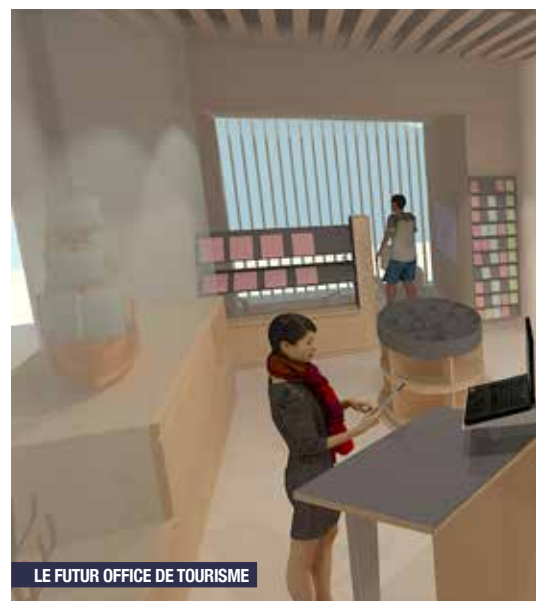
LE FUTUR OFFICE DE TOURISME

La modification du projet initial n'entraîne pas de coût supplémentaire pour la commune, la charge financière (150 000 €) étant intégralement supportée par Morlaix Communauté. La reprise des travaux est prévue pour septembre 2021 pour une ouverture au printemps 2022.